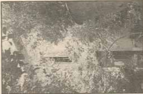
A voir dimanche à l'Atelier Cézanne, une "performance artistique et chorégraphique", dans le cadre du festival "Arborescence 01".

➤ " Arborescence 01 " : aujourd'hui et demain de 21h à une heure du matin à l'École d'Art (rue Emile Tavernan). Entrée : 6,1€ (40 F). Dimanche 7 octobre, de 18h à 21h à l'Atelier Cézanne (9, av. Paul Cézanne). Entrée : 3€ (20 F). ☎ 04 42 64 57 09. Site internet : www.arborescence.org